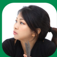
樊麗華 爵士樂鼓手