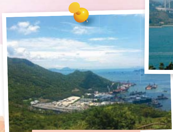
長青隧道 Cheung Tsing Tunnel