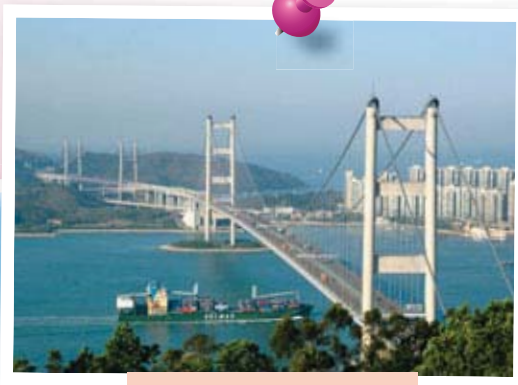
青馬大橋 Tsing Ma Bridge