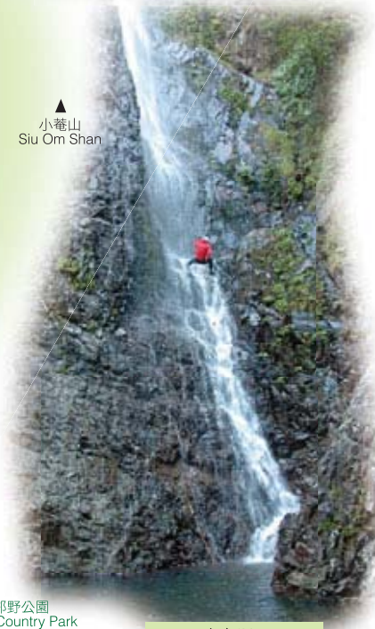
馬屎寨主瀑 Main Waterfall