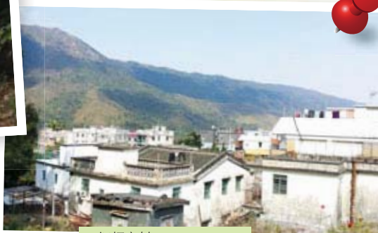
梧桐寨村 Ng Tung Chai Village