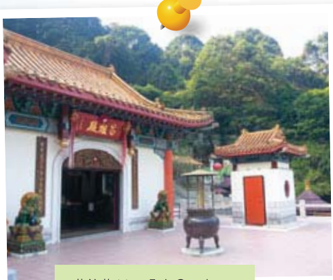
萬德苑 Man Tak Garden