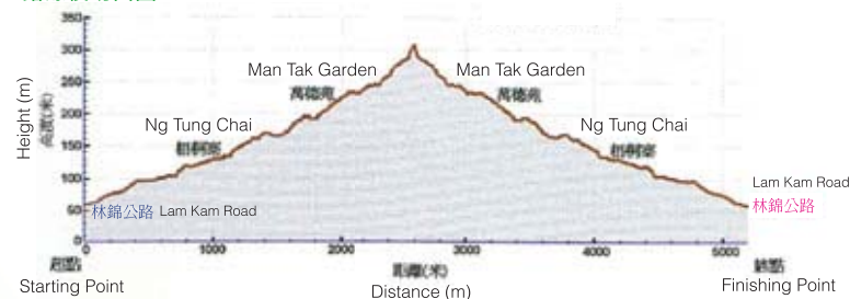
Cross-section Chart 路線橫切面圖