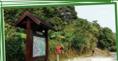
梅子林路 Mui Tsz Lam Road