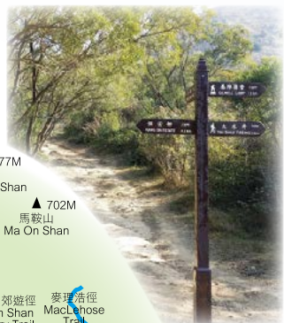
麥理浩徑 MacLehose Trail