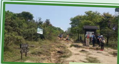
往茅坪 To Mau Ping