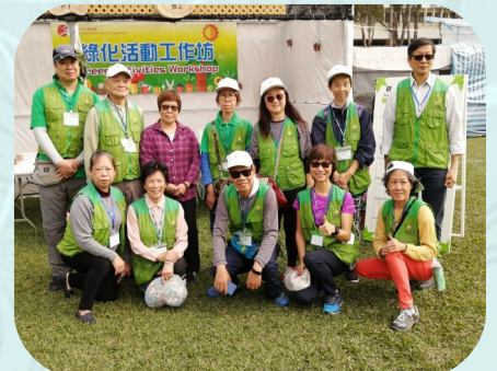
義工於綠化活動攤位前合照