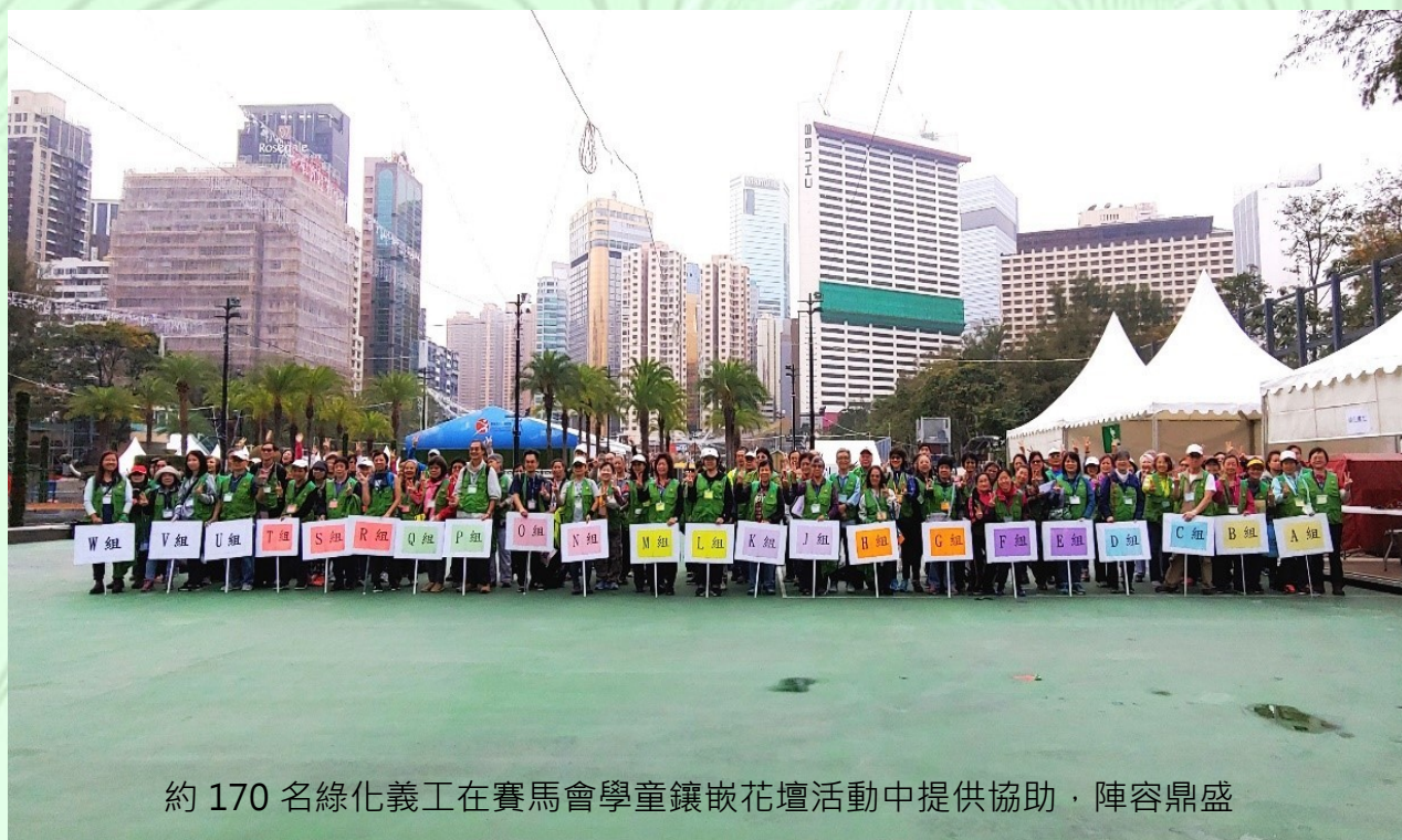
約 170 名綠化義工在賽馬會學童鑲嵌花壇活動中提供協助，陣容鼎盛