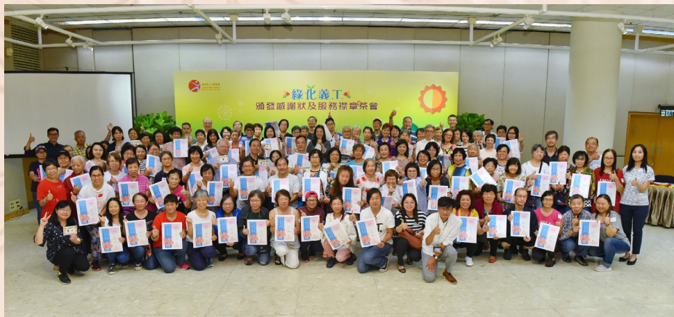
全體獲獎綠化義工大合照