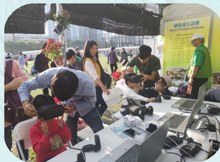
小朋友參與虛擬實境體驗遊戲，十分投入