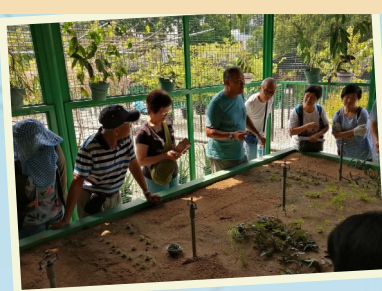
園景植物介紹及土壤檢測工作坊