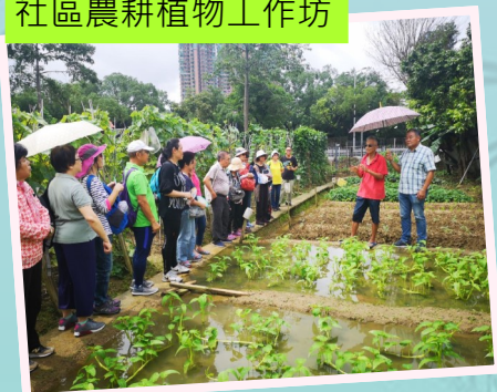
社區農耕植物工作坊

2019-20 年度的綠化義工訓練活動已經圓滿結束。本年度所舉辦的活動包括講座、工作坊和戶外導賞，旨在加強綠化義工對園藝和社區綠化的知識，並鼓勵他們積極參與社區綠化工作。讓我們一起重溫相關活動的花絮吧！