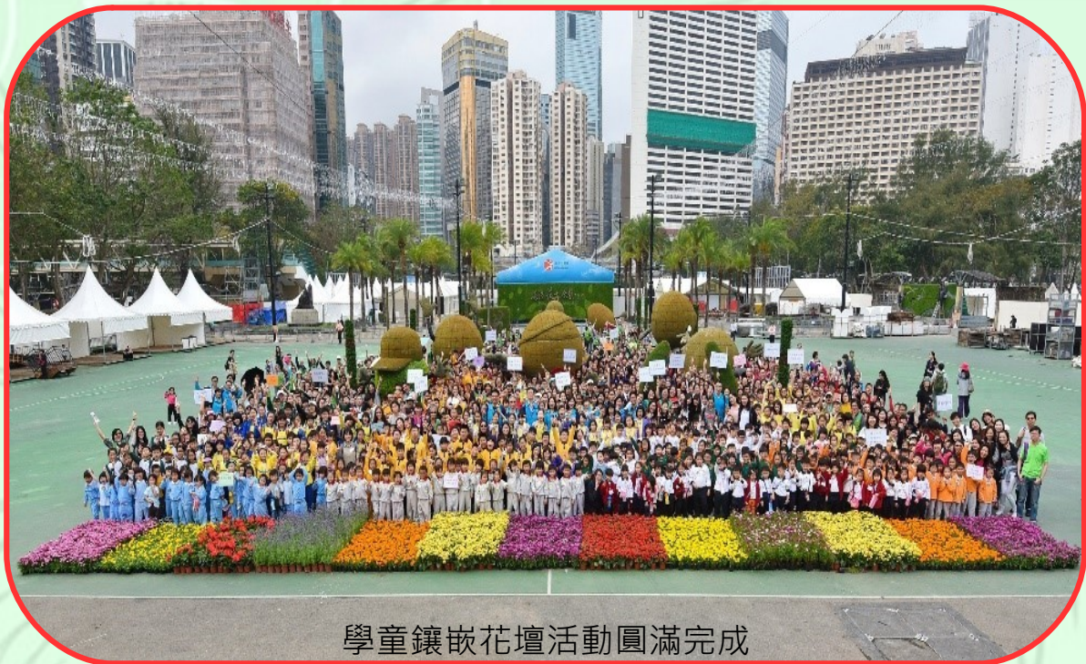
學童鑲嵌花壇活動圓滿完成