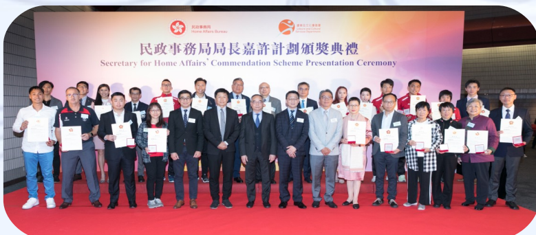
得獎者與嘉賓大合照