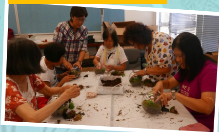
植物玻璃盆景工作坊