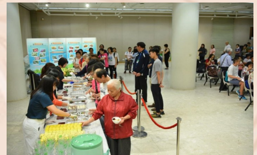
茶會氣氛非常愉快