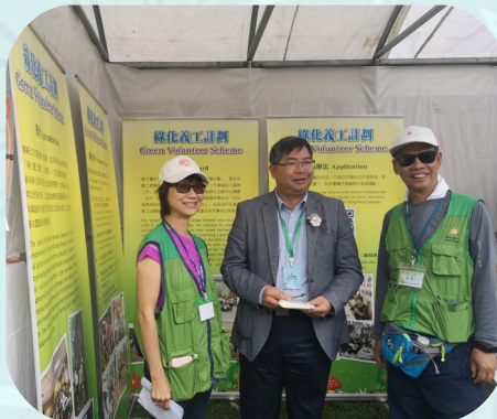
義工向嘉賓講解綠化義工計劃，並於宣傳展板前合照