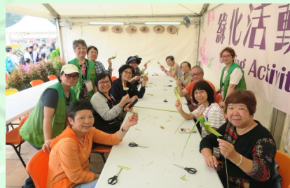
草蜢編織工作坊的參加者與義工拍照留念