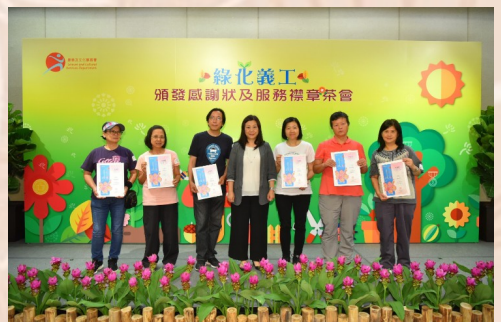
柯女士與獲頒感謝狀的義工合照