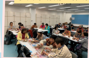
水仙球切割工作坊