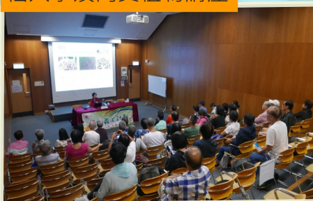
仙人掌及肉質植物講座