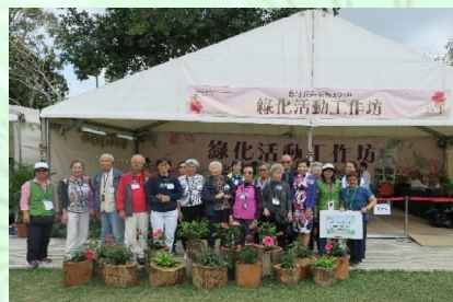
導賞團參觀綠化活動工作坊，以了解綠化義工的工作