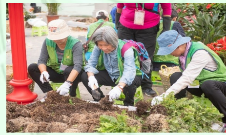
綠化義工協助回收植物