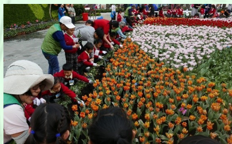
學童在綠化義工的指導下參與換花工作