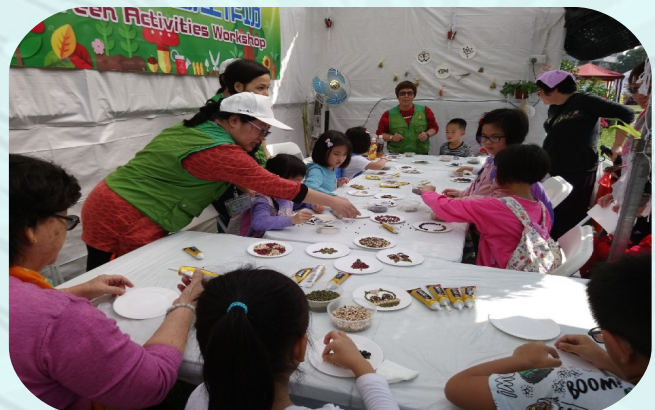
綠化義工教導參加者如何用種子製作美麗的拼圖