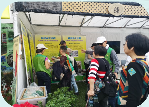
義工向市民推廣綠化義工計劃