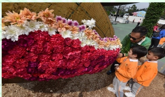
綠化義工細心示範，並指導學生把花束插入花壇