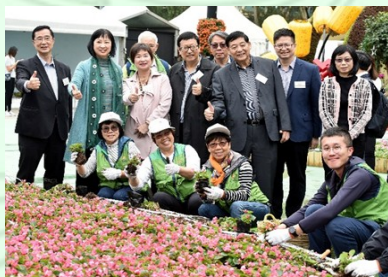
參與環保回收的綠化義工與嘉賓拍照留念