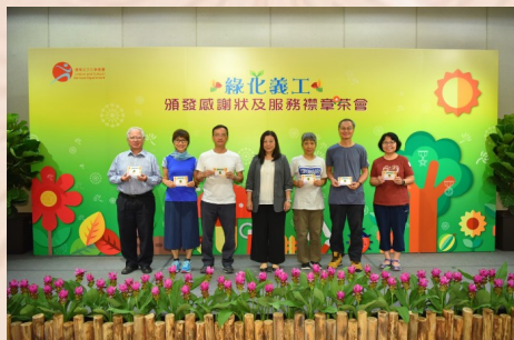
柯女士與獲頒服務襟章的義工合照