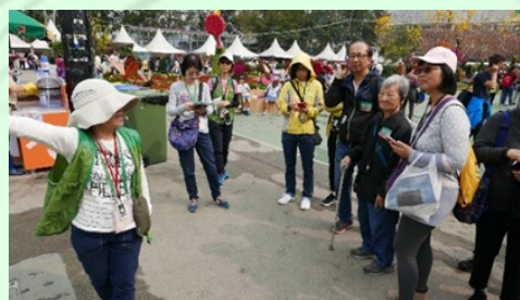
資深綠化義工帶領綠化大使導賞團參觀香港花卉展覽