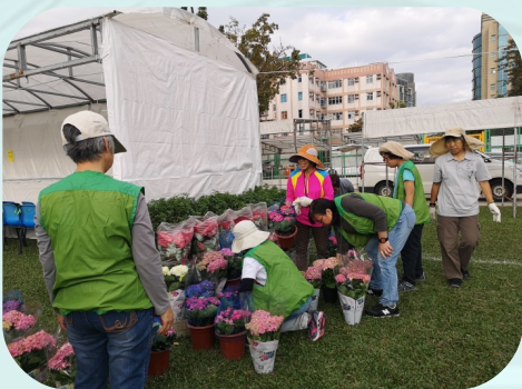
義工協助佈置花卉

為了讓綠化義工更投入參與，本署今年一改活動模式，以綠化義工活動攤位代替設置園圃。是次展覽有超過 120 名來自各分區的綠化義工參與，為參展攤位布置花卉，並於展覽期間當值，協助進行攤位活動，包括宣傳綠化義工計劃、樹木種子辨識遊戲、虛擬實境體驗遊戲、繡球花栽培講座及綠化工作坊等。