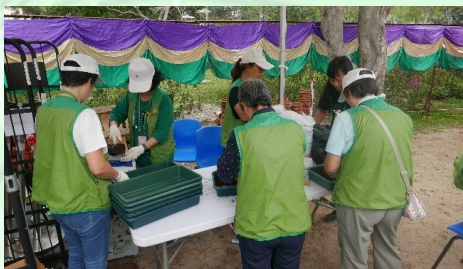
綠化義工齊心做好事前準備工作