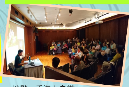
樹木常見問題及風險評估講座