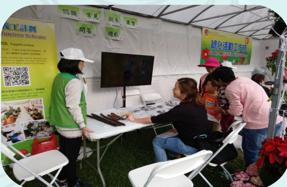
綠化義工主持問答遊戲，讓參加者加深對樹木果實的認識