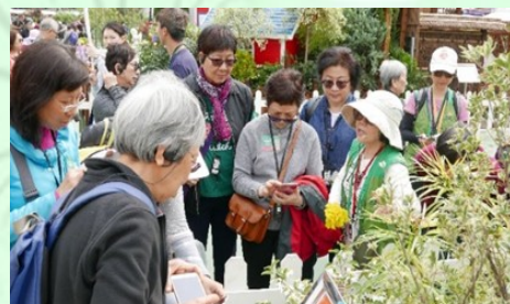
資深綠化義工解答導賞團團友的提問