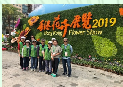
義工在展覽的花卉牆前合照