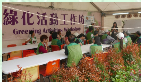
綠化義工出席活動前工作簡介