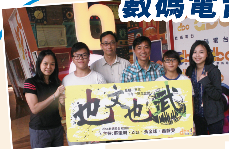
社區手球會的成員及康文署職員接受數碼電台訪問