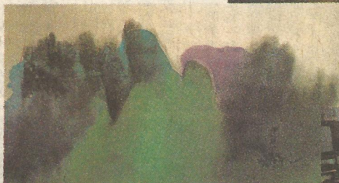
追尋張大千的神韻