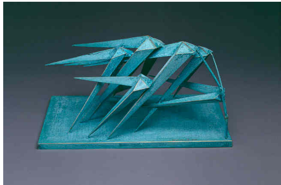
風竹 / 1988 黃銅 香港藝術館藏品