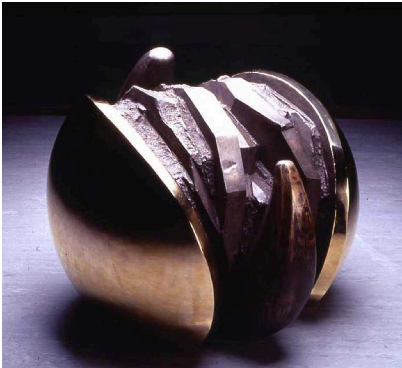
新生之二 / 1991 青銅 香港藝術館藏品