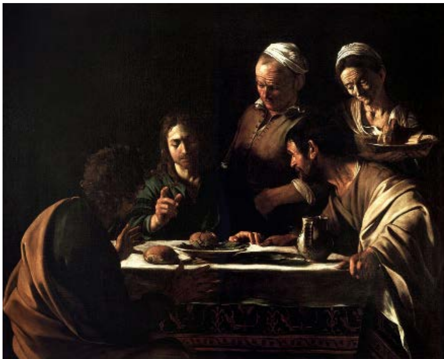
以馬忤斯的晚餐 / 1606 卡拉瓦喬 油畫 意大利米蘭布雷拉畫廊藏品