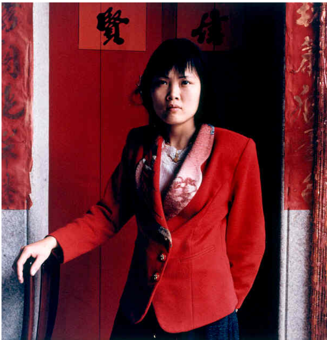
中國人 1-5 (局部) / 1996-2000 彩色照片 一組五幀