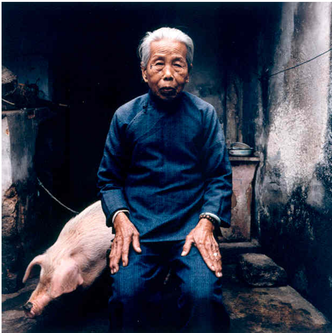
中國人 1-5 (局部) / 1996-2000 彩色照片 一組五幀