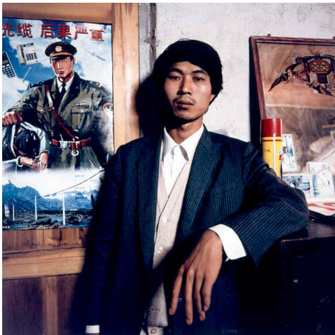
中國人 1-5 (局部) / 1996-2000 彩色照片 一組五幀