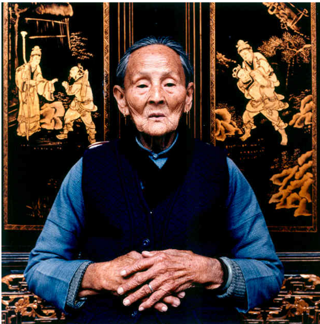
中國人 1-5 (局部) / 1996-2000 彩色照片 一組五幀