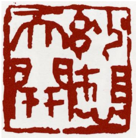
朱文方印章 / 2002