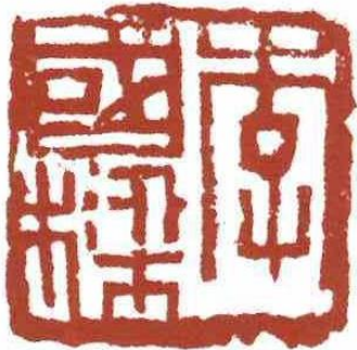
朱文方印章 / 2009