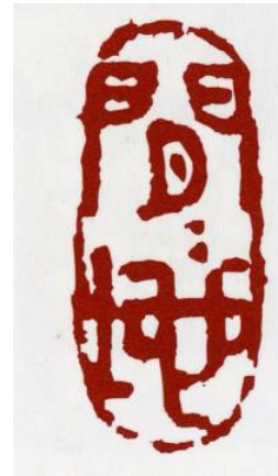
朱文橢圓印章 / 2008