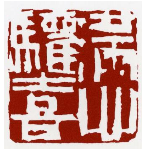
白文方印章 / 2003