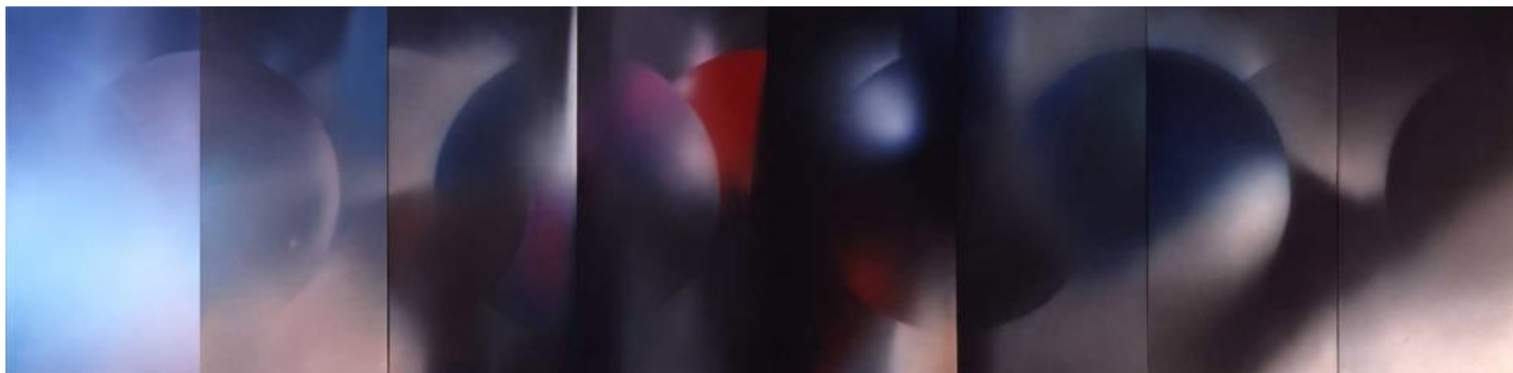
山鳴 1981 塑膠彩布本 香港藝術館藏品