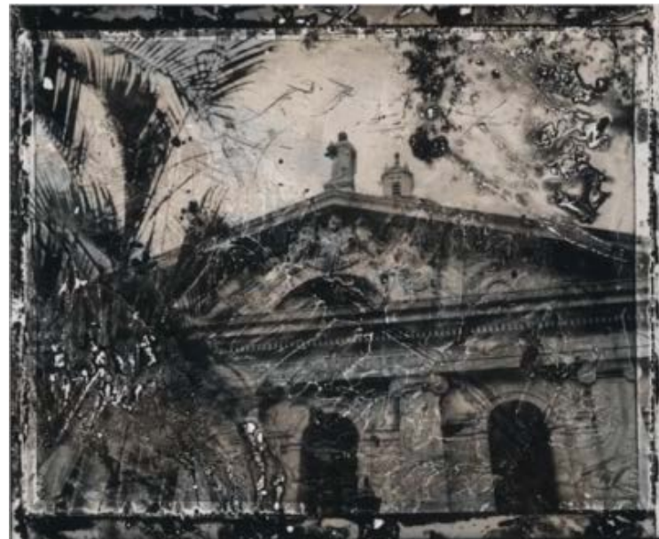
立法會大樓 / 2005 染色照片