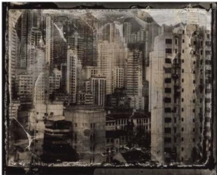
屋 No.1-5(局部) / 1998 染色照片