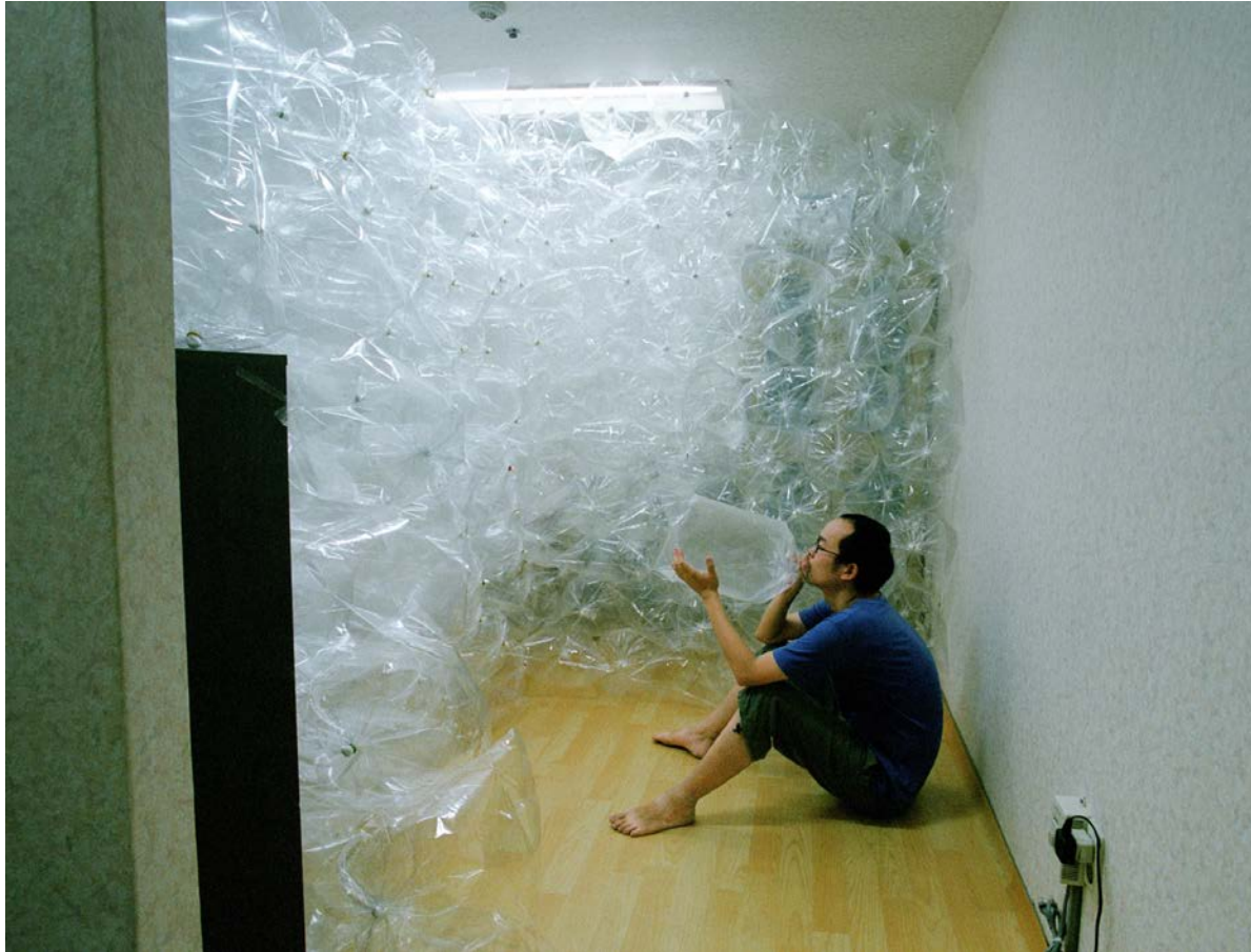
呼吸一間屋的空氣 2006 錄像