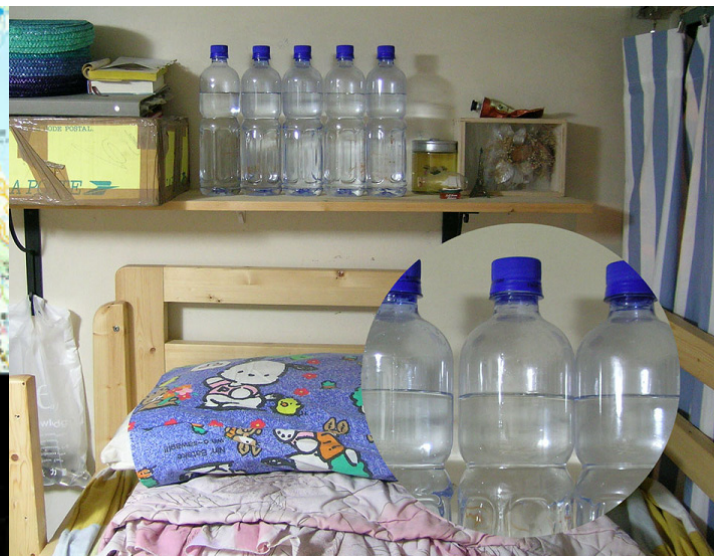
擺放在家中的海平線 2004 混合媒介裝置