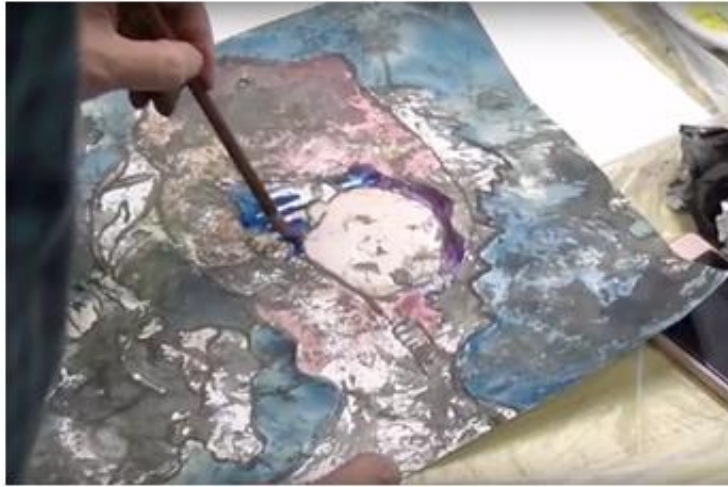
7. 以水彩著色，強化造形