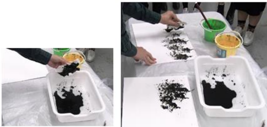
2. 將報紙弄皺，沾上墨汁，在廢紙上印一印，吸走多餘的墨，然後在畫紙上輕輕印出墨跡；學生可在不同角度印上墨痕製造變化