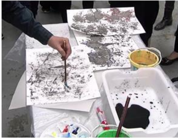
3. 在墨痕中找尋魚的形狀