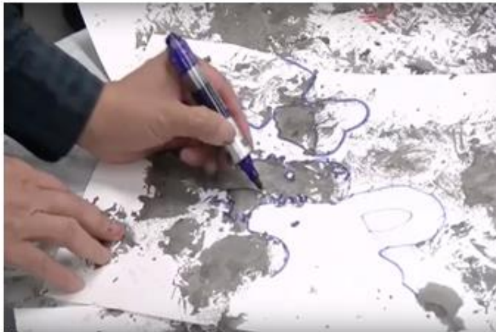
6. 透過故事形式去創作