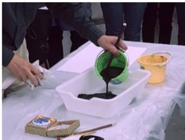
1. 先把墨汁倒進大盆，並加入適量水份