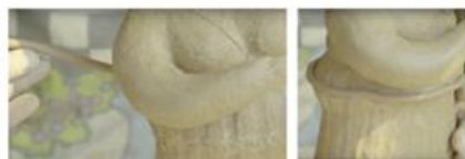
30. 圍上幼泥條鞏固接駁位。