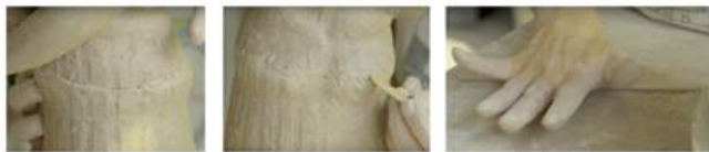
29. 接駁後，在接駁位用木批整合。揉出一條幼泥條。