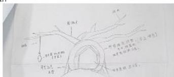
(圖片由李志達紀念學校學生繪畫)