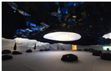
林嵐合作社 在「一樣的月光」下「明日話今天」 2015 裝置(回收雨傘布、閃燈片、音效)