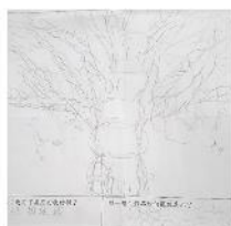
（圖片由李志輝紀念學校學生繪畫）