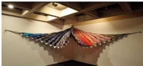
林嵐合作社 四分之一亭 2011 混合素材(回收雨傘布) 香港藝術館藏