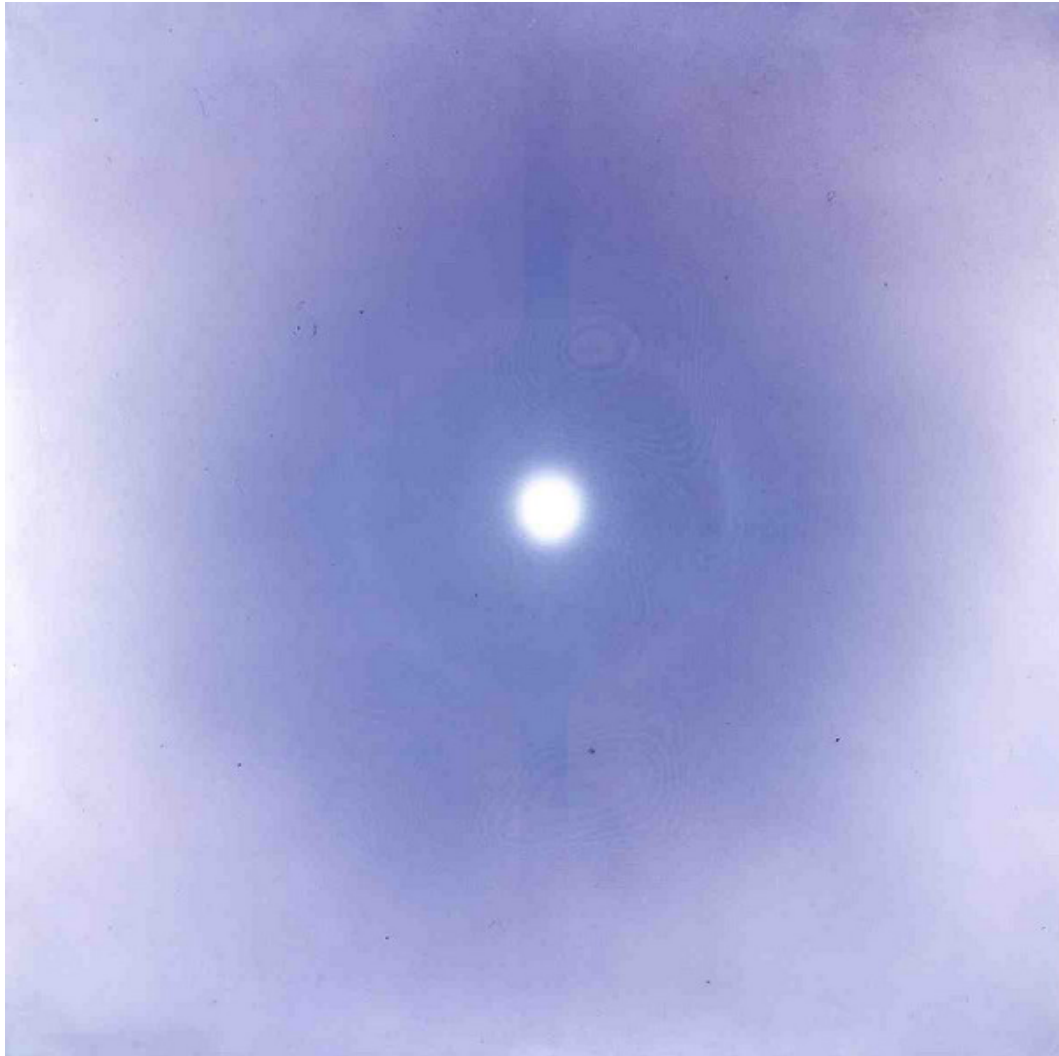
卿卿 / 1974 塑膠彩布本 香港藝術館藏品