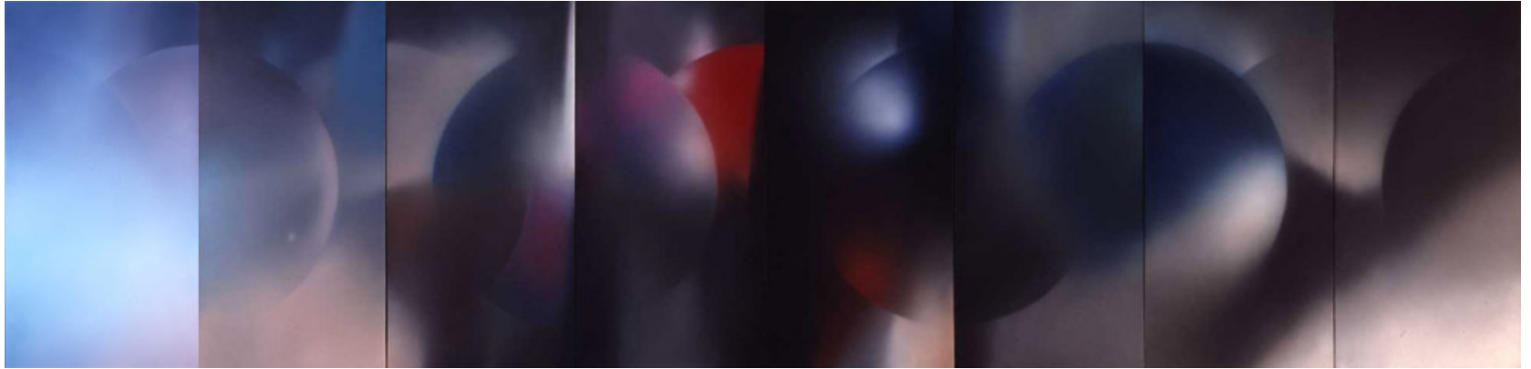
山鳴 / 1981 塑膠彩布本 香港藝術館藏品