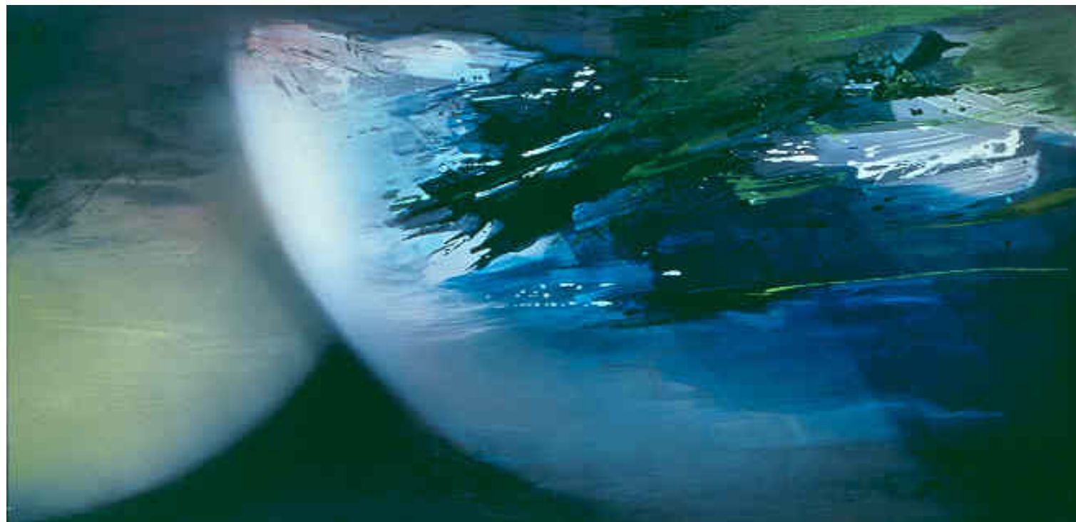
逐影 / 1989 塑膠彩布本 香港藝術館藏品