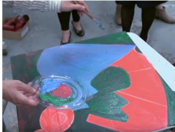
13. 可用水調稀顏料，增加透明感。