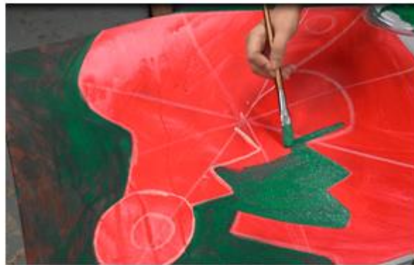
12. 選擇與底色對比強烈的色彩上色。