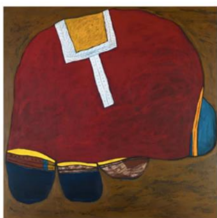
紅團/1987 塑膠彩布本 香港藝術館藏品