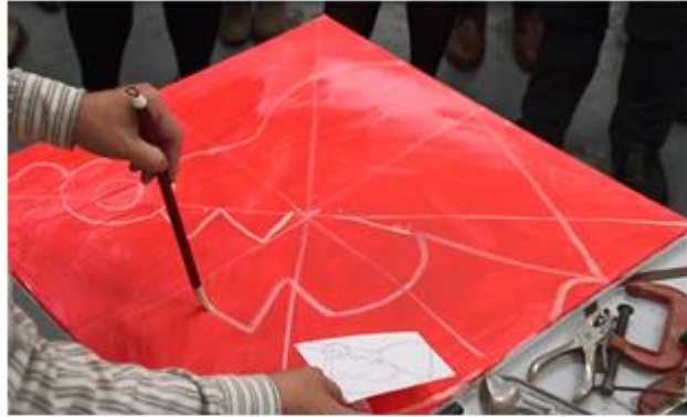
11. 按照定位線的相約位置，用粉筆把草稿放大，畫在垂布板上。