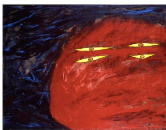
眼睛的故事/1996 塑膠彩布本 香港藝術館藏品