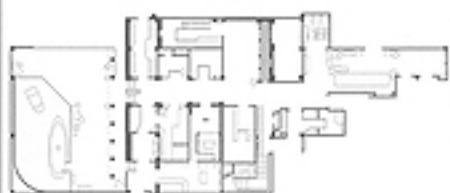
和本活動相關的部分