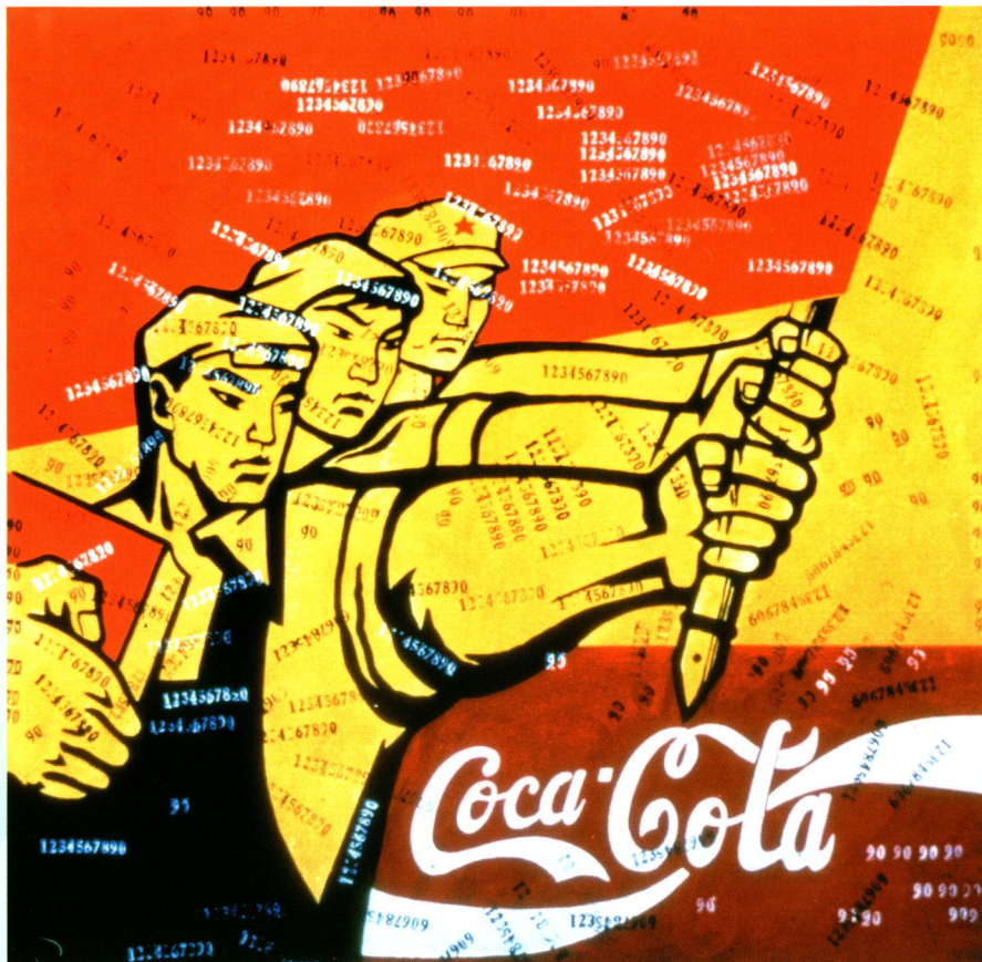
插圖 D 王廣義「大批判系列—可口可樂」