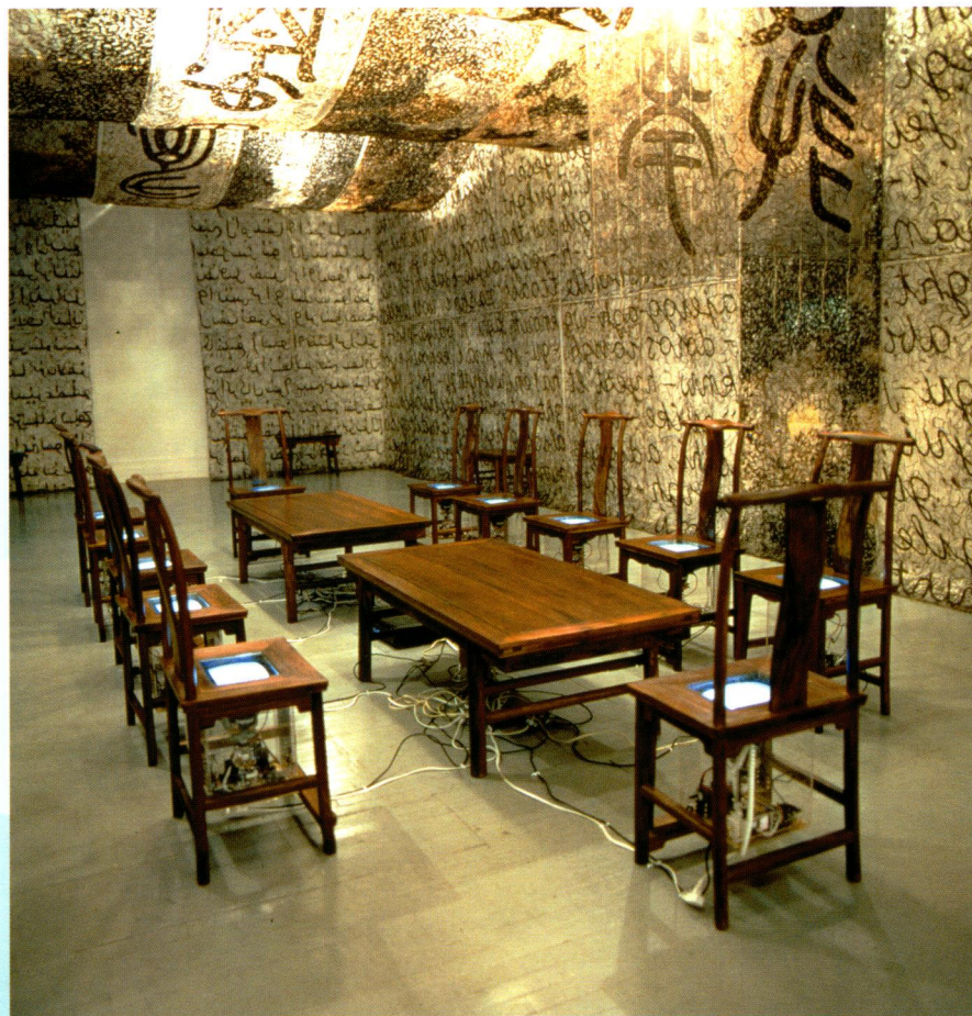
插圖A 谷文達「聯合國——中國紀念碑：天壇」

九十年代的社會以消費作主導，知識分子的地位日降，公開展覽的機會亦愈趨減少，逼使很多藝術家遁世到社會的外緣。九十年代初期，在市郊湧現一些藝術村。曾幾何時，那裡讓藝術家躲開官方的壓力，並提供了一群忠實的擁護者。至於其他藝術家，他們在都市公寓內為小圈子的同儕友好創作及展示，而作品多為裝置。公寓藝術運動，一如其名，利用簡陋的、家居的物件及材料創作；儘管如此，個別作品卻是藝術家耗極心思時間的成品。值得注意的是公寓藝術的佼佼者中有一批女性，以中國傳統婦女角色中的性別課題創作。