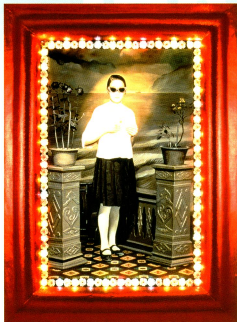
插圖G 吳天章「春宵夢」

七十至八十年代，台灣人興起尋根的熱潮，力圖從本土文化及其文藝課題中找出文化身分的定位。原住民傳統套入現代的慣用語，成為主要的靈感泉源，例如侯俊明的「新樂園」(展品18)。而急速都市化發展催化了錯位及迷失的效應，顯現在吳天章的作品中(插圖G, 展品19)。同時王俊傑「十三日羊肉小饅頭」(展品20)亦揭露了對消費主義渴求與其永無滿足之間的矛盾。