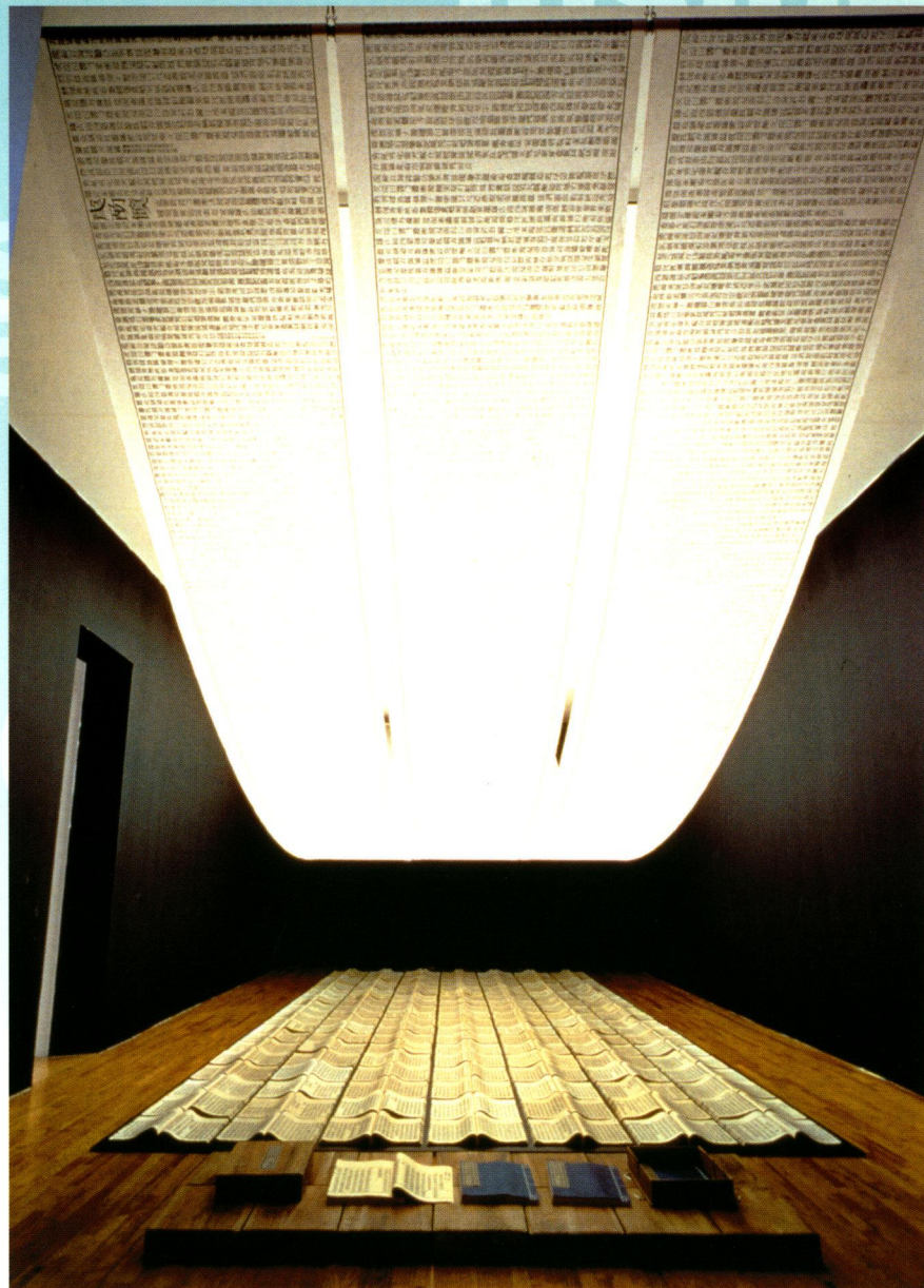
插圖 B 徐冰「天書」

中國大陸的經濟在九十年代初期經已起飛，結果衍生了一個新的都市中產階級。這個階層以時間和金錢來追求休閒文化；諸如購物消費、泳池邊閒蕩，及品嚐山珍海錯。消費主義佔了社會的主導，知識分子則進退失據，他們的窘境是究竟繼續用前衛藝術形式來推動社會及政治的變革，還是應做大眾文化的信