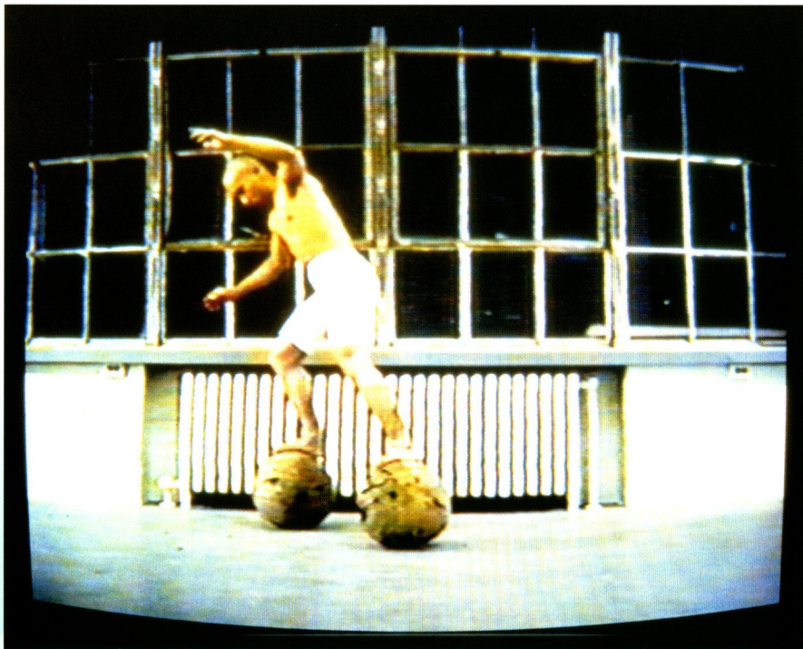
插圖 F 何兆基「雙球上步行」