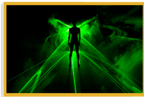
多媒體表演《賣命引擎》糅合舞蹈、錄像、音樂和激光效果，利用嶄新科技為觀眾開拓藝術體驗的新境界。

本地和海外的藝人和藝團攜手合作，把多齣藝術節委約作品搬上舞台，包括由非常林奕華製作、匯聚中港台三地藝人同台獻藝的《命運建築師之遠大前程》，以及鄧樹榮戲劇工作室聯同戲劇盒（新加坡）製作的《後代》。另外有多個演藝節目對傳統藝術進行探索，包括由日本歌舞伎大師坂東玉三郎和江蘇省蘇州崑劇院攜手演出的中日版經典崑劇《牡丹亭》、台灣心心南管樂坊演出的首齣南管現代歌劇《羽》、台灣國光劇團的新編京劇《金鎖記》，以及八十後新疆樂隊JAM與本地藝人合作、以現代音樂演繹的維族木卡姆愛情故事。藝術節其他精采節目還包括：享譽國際的德國現代室內樂團五位著名作曲家以珠江三角洲為題的亞洲首演音樂作品，以及由澳洲組合出奇舞創作，糅合舞蹈、錄像、音樂和激光的多媒體藝術表演《賣命引擎》。