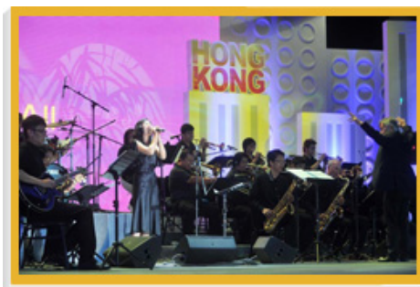
香港藝穗會在上海世界博覽會演出「港滬搖擺樂雙輝」，觀眾看得全情投入。