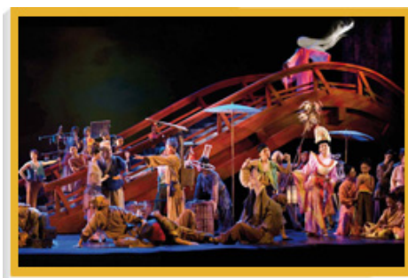
香港舞蹈團將國寶畫卷《清明上河圖》改編成精采絕倫的大型舞蹈詩，於上海世界博覽會舉行期間演出。

本署於上海世博會期間在室內場館舉行的文化表演，觀眾超過17 000人次，平均入座率達93%，部分表演更全場滿座。在世博園區內及在上海多個地點舉行的免費音樂會和節目，觀眾更多達四萬人次。至於「承傳與創造」系列中的兩項藝術展覽——「水墨對水墨」和「藝術對藝術」，參觀者約有43 000人次。