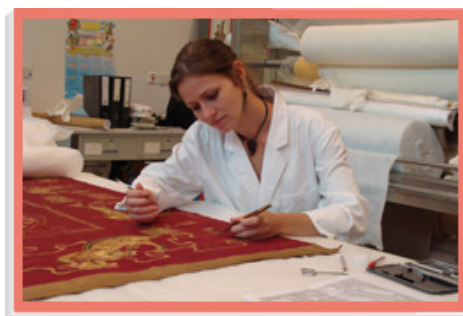
一名文物修復課程實習生正修補一幅十八世紀的掛毯。

我們亦安排員工參加海外培訓和實習計劃，以及前赴著名的國際文化機構進行交流，讓他們有機會擴闊文化知識。在海外獲得的寶貴經驗和知識，可啟發他們以更創新的方式策劃公眾活動，有助香港保持世界級盛事之都的地位。