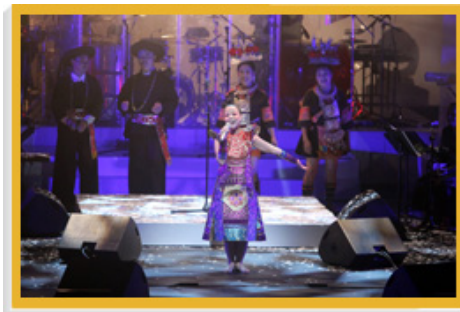
中國殿堂級歌后朱哲琴與多位當代民族音樂傳人攜手演出的音樂會，是「新視野藝術節2010」的開幕節目。

十一日期間舉行，呈獻多個世界首演節目，包括殿堂級歌后朱哲琴聯同多位當代民族音樂傳人攜手演出的開幕音樂會，以及由Budgie（英國）、Leonard Eto和Sugizo（日本）、Mabi（南非）和Knox Chandler（美國）同台獻藝的音樂大匯演「翼動：跨文化鼓樂激奏」。