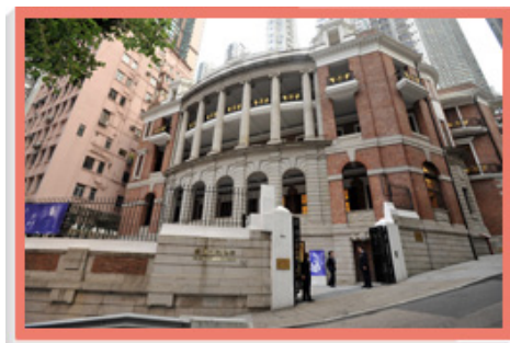
本署在二零零六年把孫中山紀念館的管理服務外判。

由於先前政府凍結招聘人手，本署亦不得不把轄下若干文化設施的管理服務外判。這些設施包括：二零零五年外判服務的香港文物探知館；二零零六年外判服務的孫中山紀念館和葛量洪號滅火輪展覽館；以及二零零七年外判服務的屏山鄧族文物館暨文物徑訪客中心。