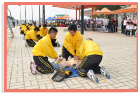
由二零一一年四月一日起，本署在轄下所有公眾游泳池引入自動心臟去顫器。圖中救生員示範以自動心臟去顫器急救的技巧。

為加強本署轄下游泳池的救生服務，我們由二零一一年四月一日起，為救生員安排全新的自動心臟去顫器訓練課程，教導他們使用該儀器和協助他們取得相關證書。