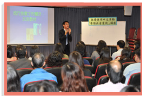
翻譯組定期邀請學者為員工舉行語文講座。

訓練組亦提供多項常設課程，內容涵蓋各個康樂和文化服務範疇，以及一般知識和技能訓練、督導管理、語文與溝通、電腦軟件應用、資訊科技等領域。