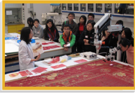
文物修復組人員（左一）向大學生介紹該組的工作。

為促進與外地的同業進行專業交流及緊貼業內的最新發展，修復組年內派員在內地舉行的國際博物館協會第二十二屆大會、第七屆歷史建築結構分析國際會議、自然因素與文獻保存保護亞洲地區研討會，以及在美國舉行的國際博物館協會2010年度金屬文物修復會議上發表多篇論文。論文題目包括《香港的文物修復教育》、《衡情度理 — 修繕，還是更換？》、《各種內牆油漆之有機化合物和揮化物的成份比較及對紙本文物的影響》，以及《綜合結構健康監測系統在保存「葛量洪號」滅火輪的應用》。