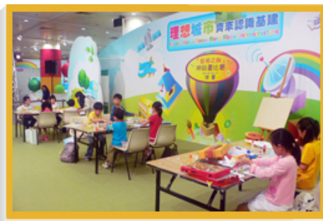
學童參加「2010閱讀繽紛月」的「香港之最」拼貼畫比賽，這項比賽旨在向兒童介紹城市的基礎建設元素。

年內，除了37間圖書館設有青少年讀書會外，五間主要圖書館也成立了家庭讀書會。公共圖書館亦與其他機構合作，舉辦「閱讀嘉年華」等全港閱讀活動。