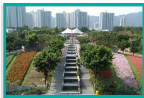
大埔海濱公園的花園佔地2 500平方米，扇形花園分成九排，廣植燦爛時花。

大埔海濱公園佔地22公頃，是本署轄下最大型的公園。園內有一座香港回歸紀念塔，高32米，遊人可登上塔頂俯瞰吐露港和鄰近地區的美麗景致。公園的其他設施包括長達1 000米的海濱長廊、昆蟲屋、露天劇場、中央水景設施、有蓋觀景台、兒童遊樂場、草地滾球場、門球場，以及多個主題花園：花海、香花園、錦葵園、西式花園、生態花園、棕櫚園、香草園、榕樹園和茶花園。