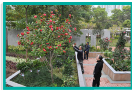
大埔海濱公園新設茶花園，遊人樂在其中。