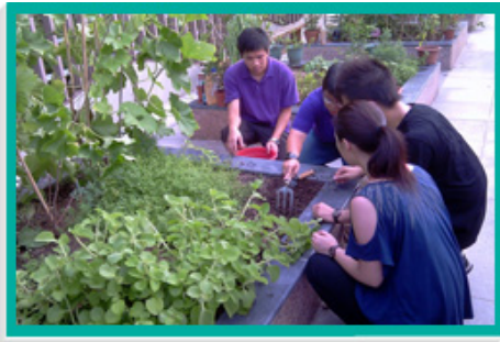
「社區園圃計劃」旨在鼓勵市民參與社區層面的綠化活動及實踐綠色生活。圖中導師正向參加者教授種植技巧。

「社區園圃計劃」已在二零零五年年底擴展至全港18區。該計劃旨在鼓勵市民參與社區層面的綠化活動，身體力行，盡力支持環保，並通過參加種植活動，加強綠化和環保意識。18區目前已闢設了21個社區園圃。在二零一零至一一年度，本署共舉辦了52個種植研習班，參加者超過11 300人。