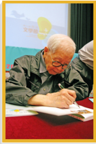
香港中央圖書館舉辦「劉以鬯與香港文學」專題展覽，回顧本地文學發展。圖中名作家劉以鬯為讀者在著作上簽名。

香港公共圖書館又舉辦多元化的閱讀計劃和閱讀相關活動，推廣閱讀風氣和鼓勵市民培養閱讀興趣。年內舉辦的活動既配合「中國2010年上海世博會：城市，讓生活更美好」的主題，又以城市為題從不同角度作出介紹。活動包括：「4·23世界閱讀日創作比賽—今日城市」、「2010年度與作家會面—品讀城市」、「專題故事劇場—勇闖科技城」、「閱讀繽紛月」展覽：「理想城市—齊來認識基建」，以及「都會香港」專題講座。