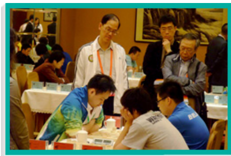
民政事務局局長曾德成（站於左方）全神貫注觀看香港隊與北京隊在「第四屆全國體育大會」象棋項目專業男子組比賽中對弈。