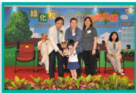
在「綠化校園工程獎頒獎典禮」上，41間中小學及幼稚園獲得嘉許，以表揚其綠化校園工程水平甚高，在綠化環境方面貢獻良多。

年內推行的「綠化校園資助計劃」是本署的學校綠化活動之一，為超過850間參加計劃的學校及幼稚園提供現金資助，鼓勵他們在校園多種花木和舉辦綠化教育活動，並安排兼職導師給予園藝技術指導。本署會就各學校的計劃進行評選，向優勝學校頒發綠化校園工程獎。本署又舉辦「一人一花」計劃，向大約36萬名學童派發幼苗，供他們在家中或校內培植，以增進栽種知識，並且培養這方面的興趣。