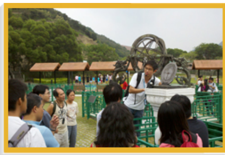
參觀者通過天文公園內的複製品認識中國古代天文儀器。

太空館已獲得撥款，為兩個展覽廳進行翻新工程，並會設計和裝置新展品，以便營造一個模擬環境，讓參觀者體會穿梭時空的經驗。太空館的網站( http://hk.space.museum )載有大量關於天文和太空科學的資料和教材，深受大眾歡迎。