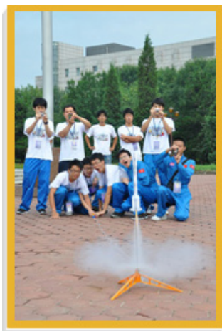
參加「少年太空人體驗營」的年輕太空人成功發射火箭模型。

年內，太空館推出了兩個天象節目、四部全天域電影和兩套學校節目，共吸引375 665名觀眾。此外，太空館與香港中華總商會、中國航天員科研訓練中心及西昌衛星發射中心合辦「少年太空人體驗營」。體驗營於二零一零年八月三日至九日舉行，30名獲選參加的本地中學生前赴中國北京和西昌兩地，學習基本的太空科學知識和體驗太空人艱苦的訓練。年內，太空館舉辦了11個短期專題展覽，連同太空科學展覽廳和天文展覽廳，總計參觀者達398 421人次。此外，亦舉行了229項推廣活動，共有24 725名市民參加。