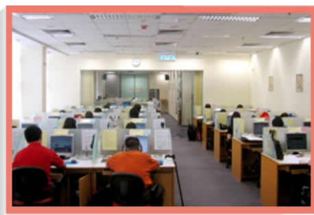
大會堂公共圖書館電腦資訊中心裝設新的公眾電腦工作站。

各公共圖書館共設置逾1 700個具上網功能的電腦工作站，供市民使用。隨着市民對上網服務的需求日益增加，本署已提升基礎設施及當中345個電腦工作站，以提供更快速的上網服務。