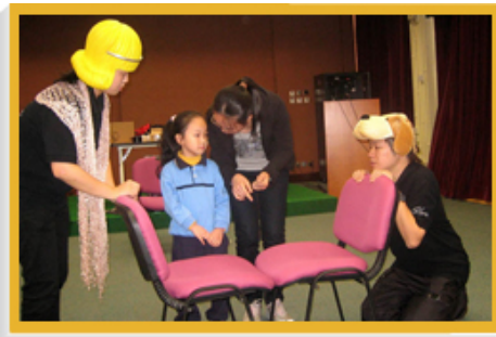
香港公共圖書館經常舉辦各式各樣與閱讀有關的活動，培養兒童對閱讀的興趣。在39間圖書館舉行的專題故事劇場—「勇闖科技城」是其中一項活動。